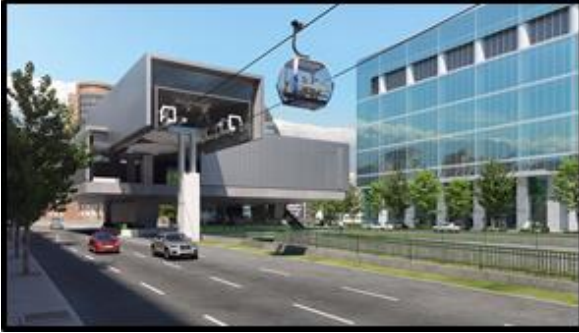
Estación sobre canal San Carlos