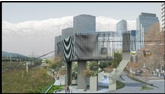
Edificio Técnico "Punto de Quiebre" (Av. Andrés Bello / Nueva Tajamar - solo redirecciona trazado)