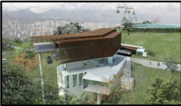
Estación Parque Metropolitano (Incluye equipamiento doble-motriz y nuevo acceso al Parque)