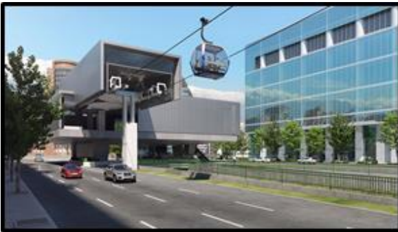
Estación sobre canal San Carlos 1.500 m 2