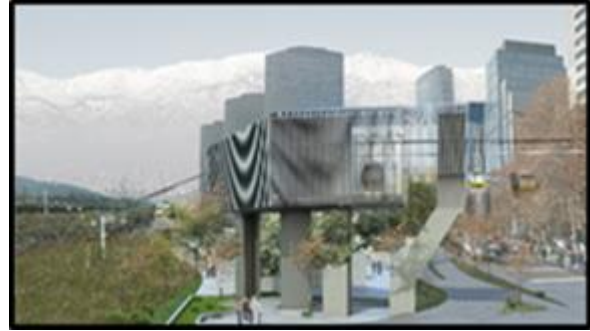
Edificio Técnico "Punto de Quiebre" (Av. Andrés Bello / Nueva Tajamar - solo redirecciona trazado) 71 m 2 útiles