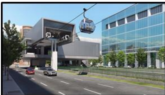
Estación sobre canal San Carlos