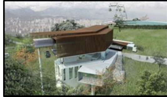
Estación Parque Metropolitano

(Incluye equipamiento doble-motriz y nuevo acceso al Parque)