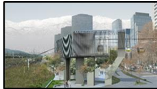
Edificio Técnico “Punto de Quiebre” (Av. Andrés Bello / Nueva Tajamar - solo redirecciona trazado) 71 m2 útiles