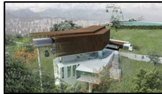
Estación Parque Metropolitano (Incluye equipamiento doble-motriz y nuevo acceso al Parque) 2.300 m2