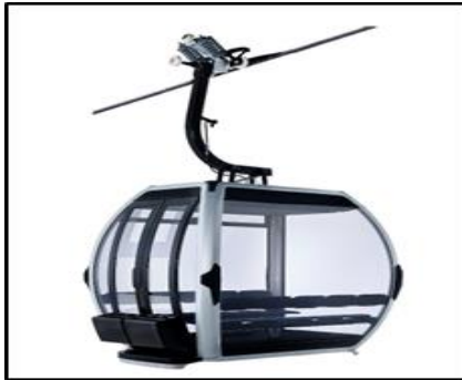
Cabina Omega V – 10 pasajeros