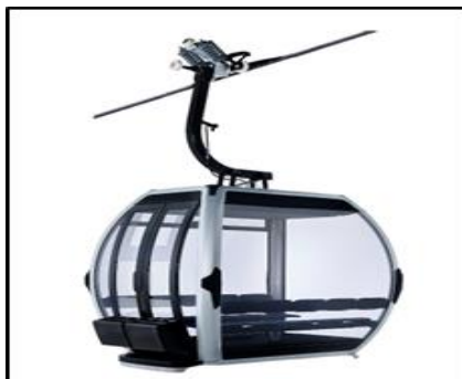
Cabina Omega V – 10 pasajeros