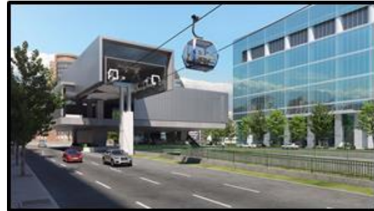
Estación sobre canal San Carlos 1.500 m 2