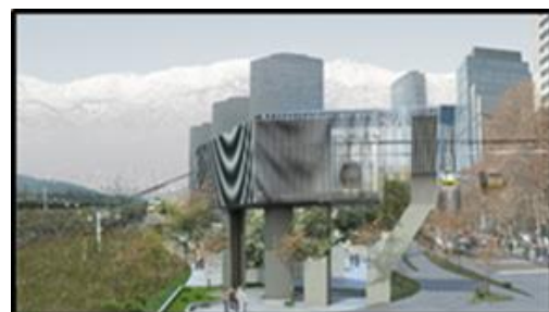
Edificio Técnico "Punto de Quiebre"