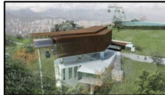
Estación Parque Metropolitano (Incluye equipamiento doble-motriz y nuevo acceso al Parque) 2.300 m 2