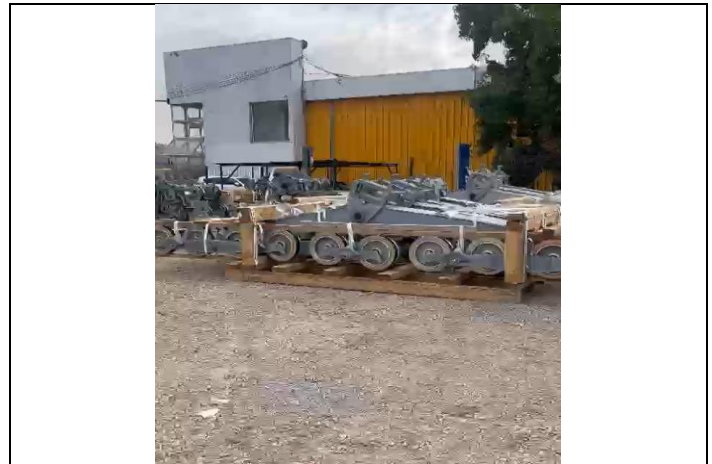
Balancines de las Torres