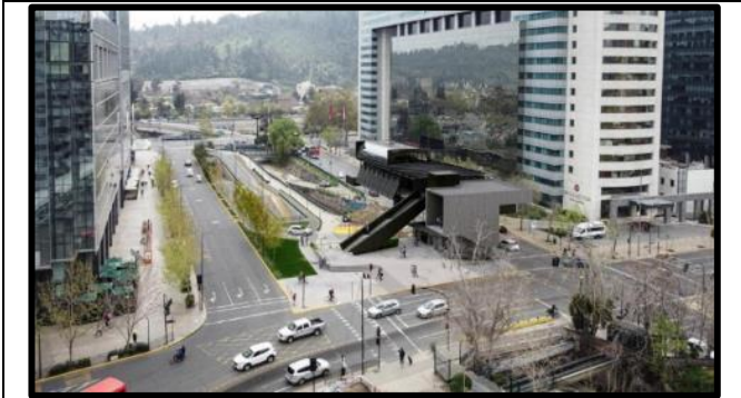
Estación Canal San Carlos