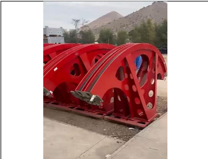
Poleas Doble Garganta