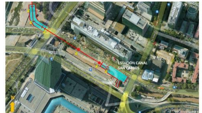
Ubicación Estación Canal San Carlos