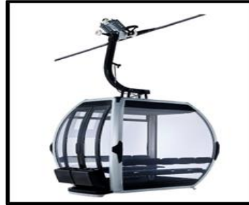
Cabina 10 pasajeros