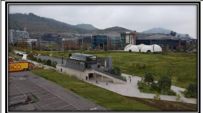
Estación Santa Clara