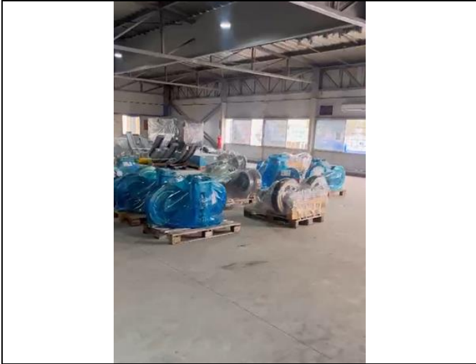
Equipos de Andenes