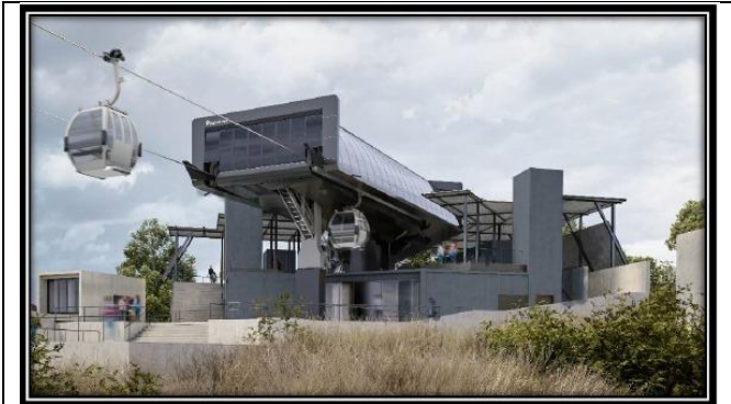
Estación Parque Metropolitano