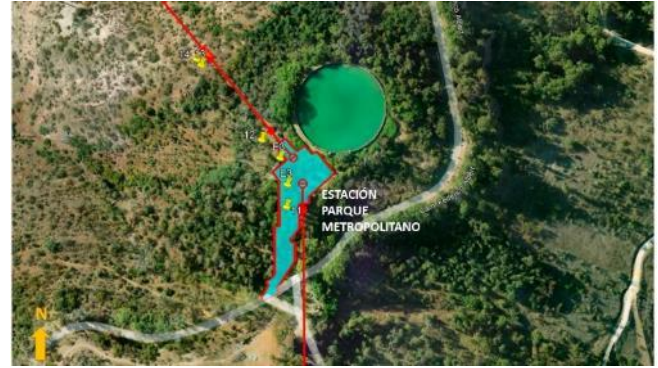
Ubicación Estación Parque Metropolitano