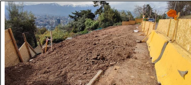
sector Pila 9