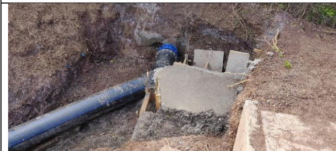
By-pass para Regadío Estación Parque Metropolitano