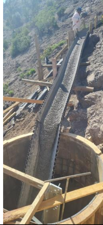
Hormigonado de fundación torre AT