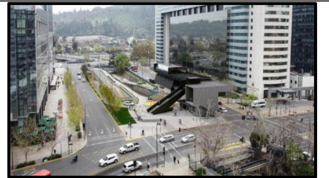
Estación Canal San Carlos