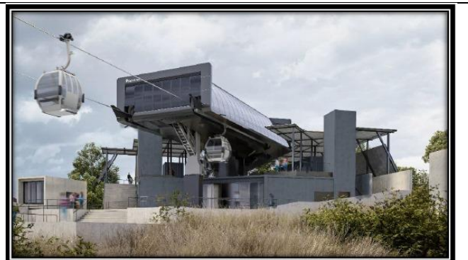
Estación Parque Metropolitano