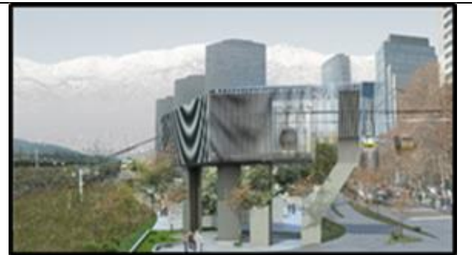
Punto de Quiebre