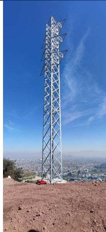
Torre AT N°61