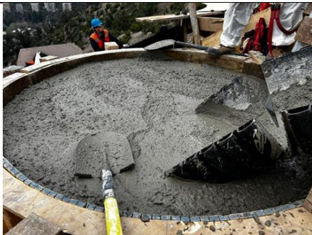
Hormigonado de fundación torre AT