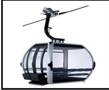
Cabina 10 pasajeros