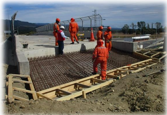
Enfierradura Losa de Acceso Estribo de Salida Paso Superior Laraquete Sur km: 0,480.