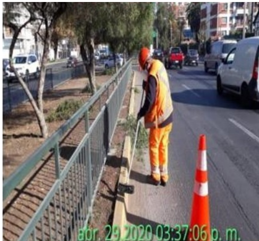
Mantención de Vallas Peatonales.