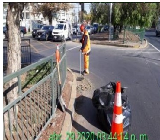
Limpieza calzadas y soleras.