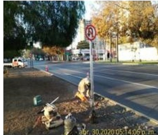
Reposición de señales verticales.

Se observan actividades de conservación de la infraestructura preexistente, realizada por la Sociedad Concesionaria (SC) en algunos sectores del eje enfocados a la limpieza del bandejón central y la mantención de vallas peatonales y limpieza de calzadas, durante el mes de mayo de 2020.