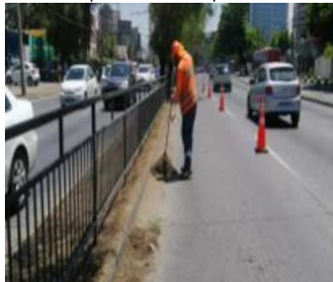
Extracción de vegetación.