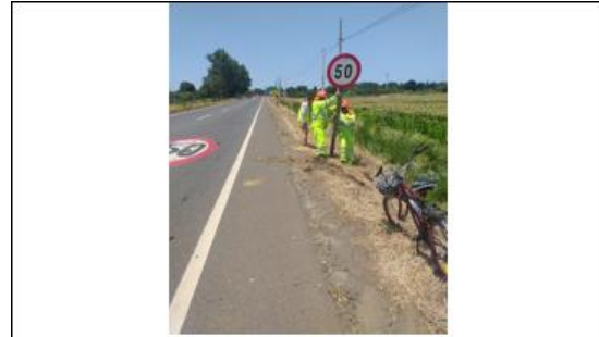
Ilustración N°2: Reposición de Señalización Ruta 180