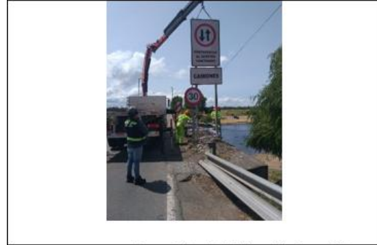
Ilustración N°1: Reposición de Señalización Ruta 180