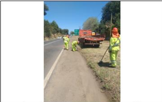
Ilustración N°6: Limpieza de Cunetas Ruta 180