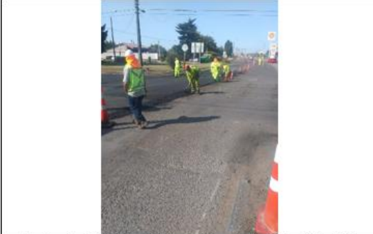
Ilustración N°5: Reposición de Carpeta Asfáltica Ruta 180