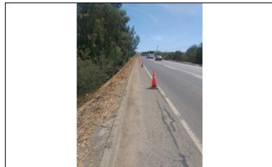
Ilustración N°4 Roce y Despeje de Faja en Ruta 180