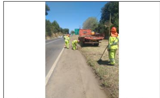
Ilustración N°3: Roce y Despeje de Faja en Ruta 180