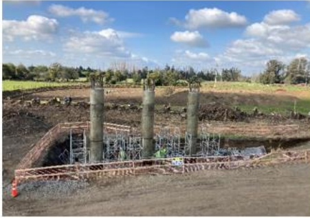
Ilustración N°1: Columnas Cepa Central Paso Inferior El Ciruelo