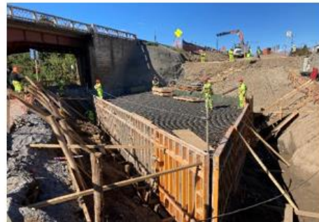
Ilustración N°6: Armadura Estribo Salida Puente Huequén