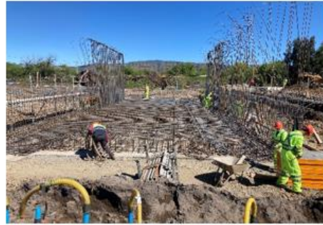
Ilustración N°5: Losa Inferior Paso Superior Roblería