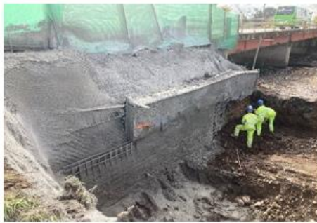
Ilustración N°3: Refuerzo Talud Existente Puente La Suerte