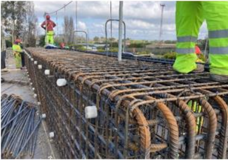
Ilustración N°2: Armadura Cabezal Apoyo Paso Inferior El Ciruelo