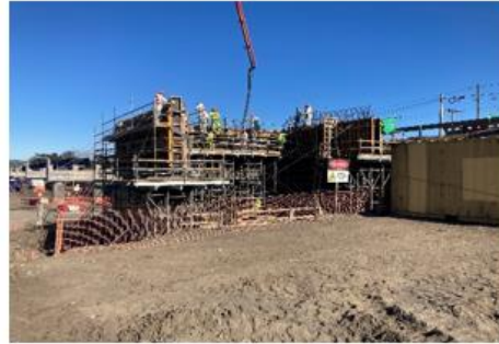
Ilustración N°4 Estribo Entrada Puente Coihue