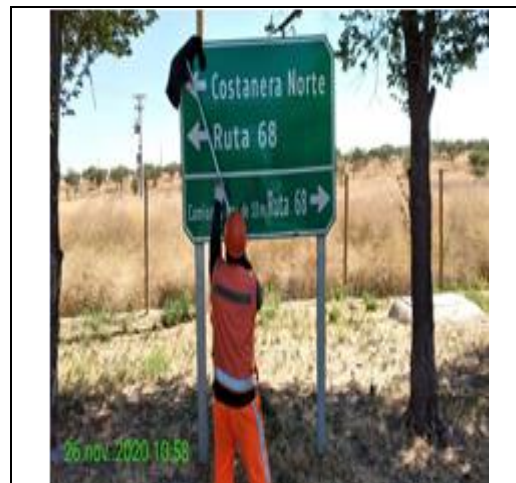
Mantenimiento y conservación de señales verticales