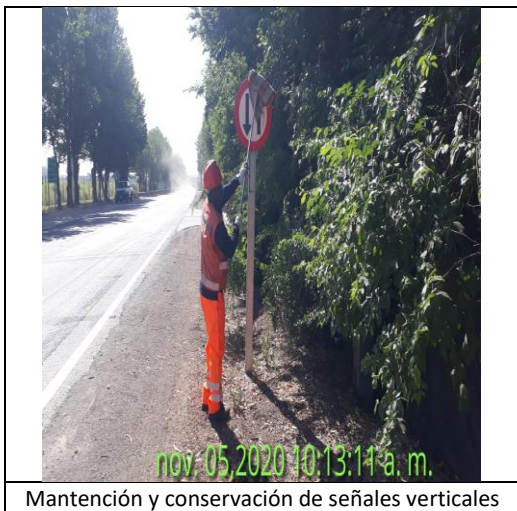
Mantenimiento y conservación de señales verticales

Mantenimiento de la infraestructura preexistente durante el periodo