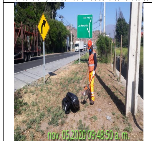
Mantenimiento y conservación de paisajismo