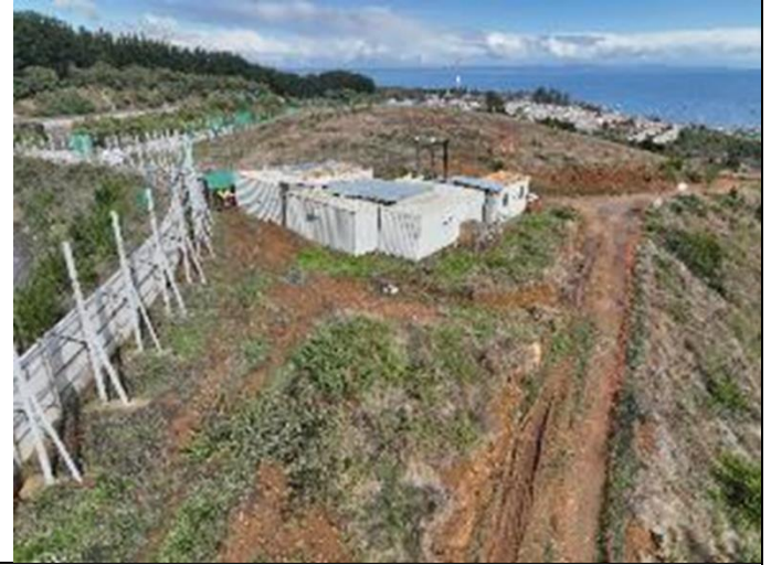
Vista aérea hacia acceso Oeste. Hospital de Lota.