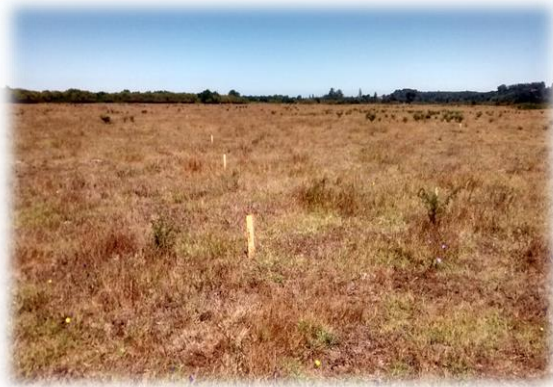
Estacado faja de 40 mts. De ancho, Sector A.

El estándar definido para la obra es una doble calzada expresa, de dos pistas por sentido, que se conectará con las Avenidas Costanera, por el norte, y la Ruta 160, por el sur, a través de enlaces desnivelados. Ambas calzadas estarán separadas por una mediana y serán segregadas por una barrera de contención. La velocidad máxima permitida y señalizada será de 80 km/h. Además de sus dos enlaces, la obra cuenta con atravesos, calles de servicio, pasarelas y una vereda - ciclovia segregada a lo largo de todo el trazado de la autopista, con sus respectivas conexiones a los circuitos peatonales y ciclistas locales.