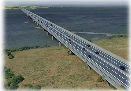
Rivera Norte, Sector A.

El estándar definido para la obra es una doble calzada expresa, de dos pistas por sentido, que se conectará con las Avenidas Costanera, por el norte, y la Ruta 160, por el sur, a través de enlaces desnivelados. Ambas calzadas estarán separadas por una mediana y serán segregadas por una barrera de contención. La velocidad máxima permitida y señalizada será de 80 km/h. Además de sus dos enlaces, la obra cuenta con atraviesos, calles de servicio, pasarelas y una vereda - ciclovia segregada a lo largo de todo el trazado de la autopista, con sus respectivas conexiones a los circuitos peatonales y ciclistas locales.