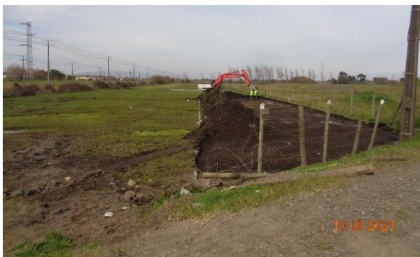
Camino provisorio eje 87.

Se inician trabajos de escarpe en sector A, camino provisorio eje 87 en sentido de avance. Obra provisoria para tener acceso a la ribera Norte del proyecto Puente Industrial.