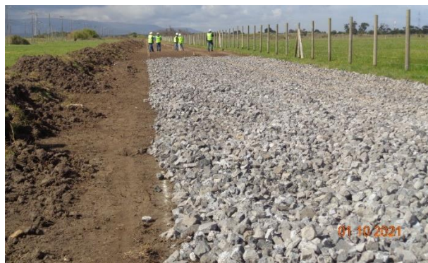
Camino provisorio con material de rodadura