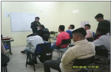
Se fiscaliza entrega de material escolar modulo 76

Fiscalización al Subprograma Social y Psicosocial en el desarrollo de Taller Intercultural dirigido a internos del M-46 del Complejo Penitenciario.