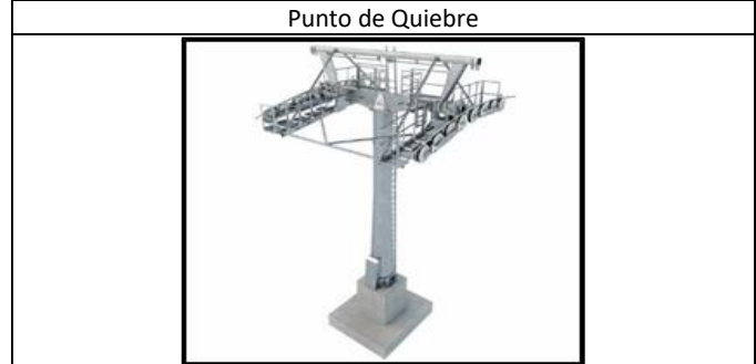
Punto de Quiebre