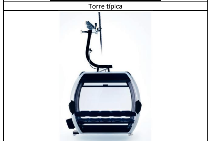
Cabina 10 pasajeros