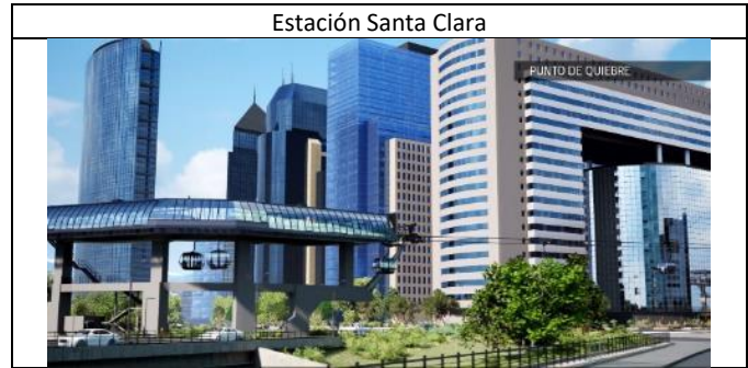
Estación Santa Clara