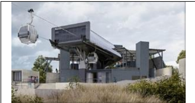
Estación Parque Metropolitano