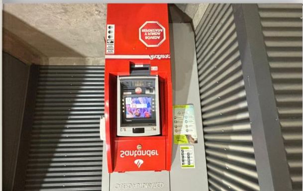
5. Zona Servicios