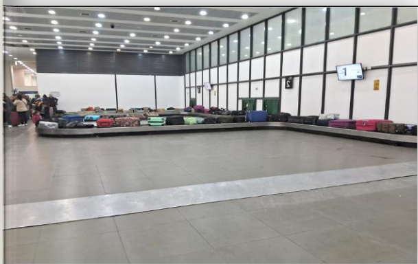
3. Zona de Aduana