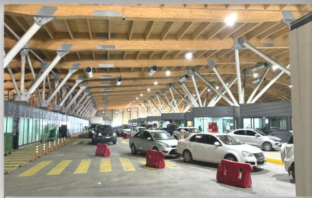
2. Zona de Vehículos Livianos