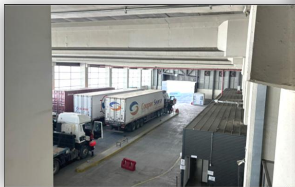
4. Zona de Camiones