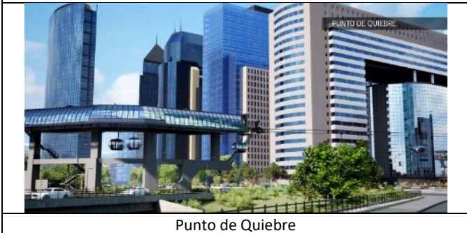
Punto de Quiebre