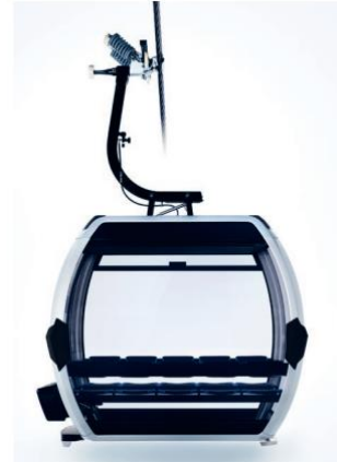
Cabina 10 pasajeros