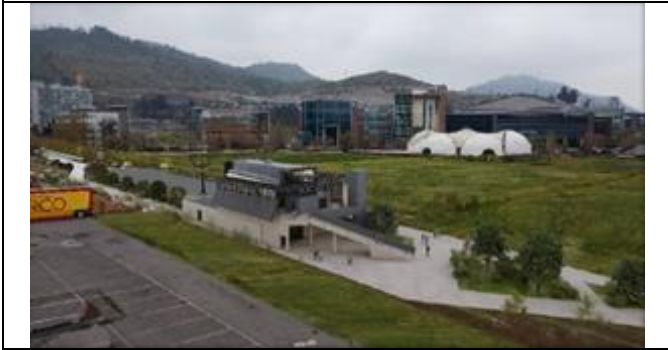
Estación Santa Clara