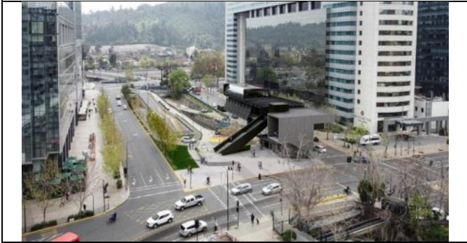
Estación Canal San Carlos