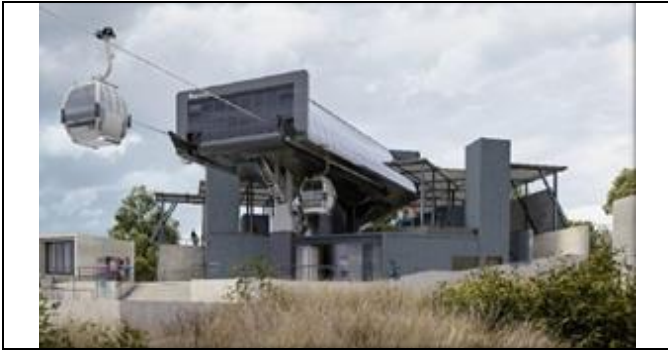
Estación Parque Metropolitano