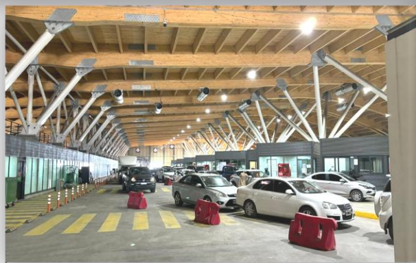
2. Zona de Vehículos Livianos