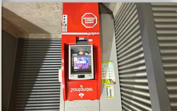
5. Zona Servicios