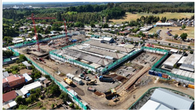
HOSPITAL DE NACIMIENTO