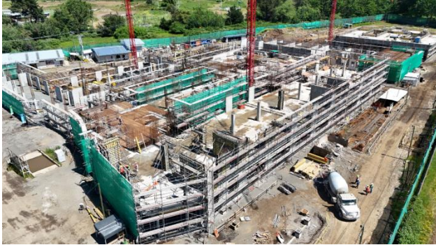
HOSPITAL DE SANTA BÁRBARA