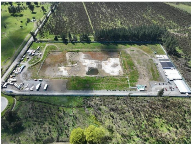
HOSPITAL DE CORONEL