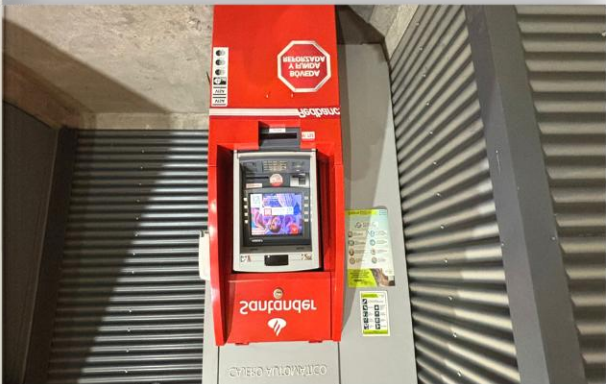
5. Zona Servicios