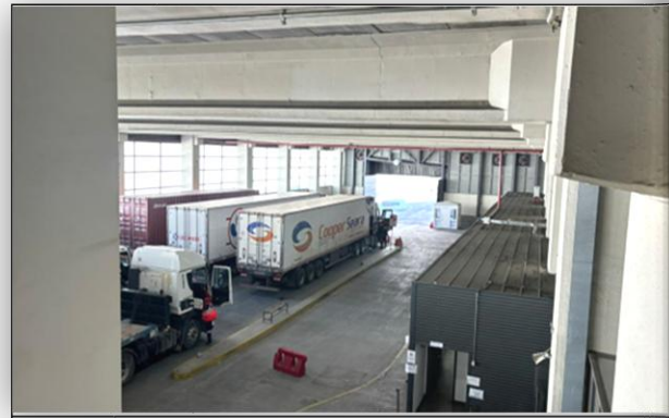
4. Zona de Camiones