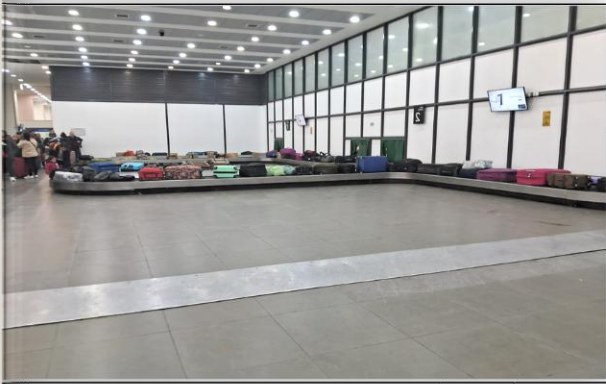
3. Zona de Aduana