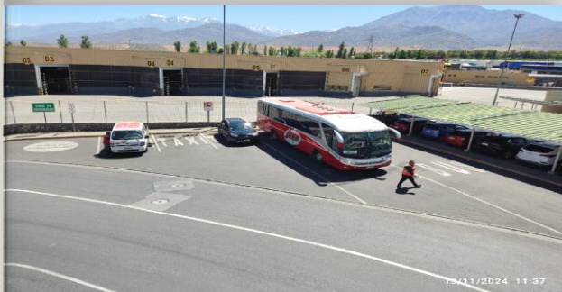
5. Área de Andenes