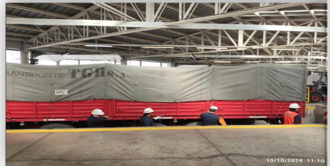
6. Zona Inspección