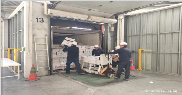
3. Revisión de Carga