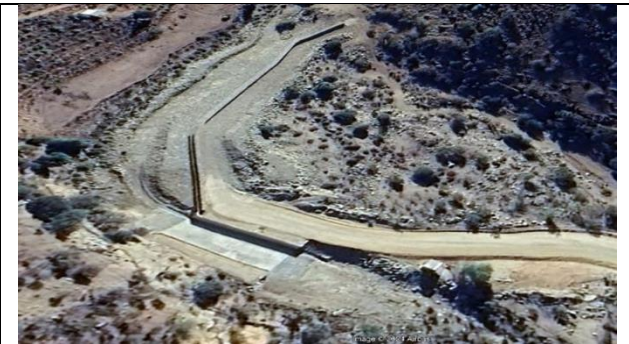
Fotografía N°5, Vista estación de control fluviométrica Frutillar