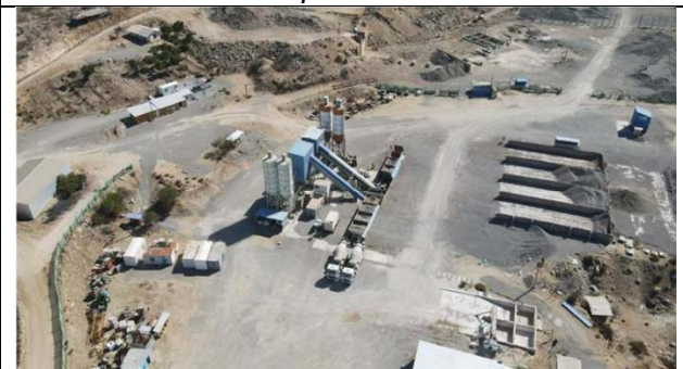
Fotografía N°7. Planta de hormigón