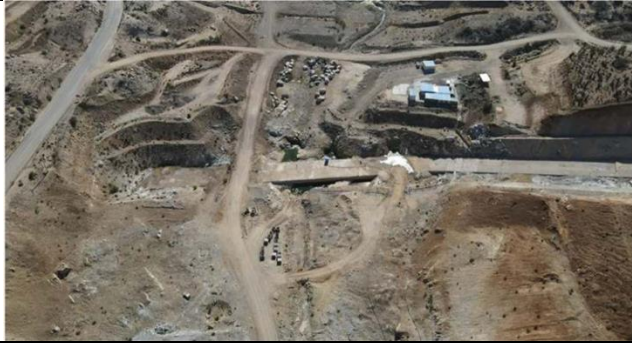
Fotografía N°9. Plinto Valle