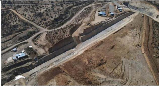
Fotografía N° 10. Plinto Izquierdo