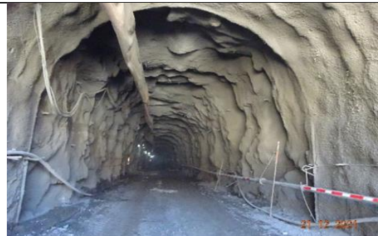
Vista General Túnel de Desvío – Portal Entrada