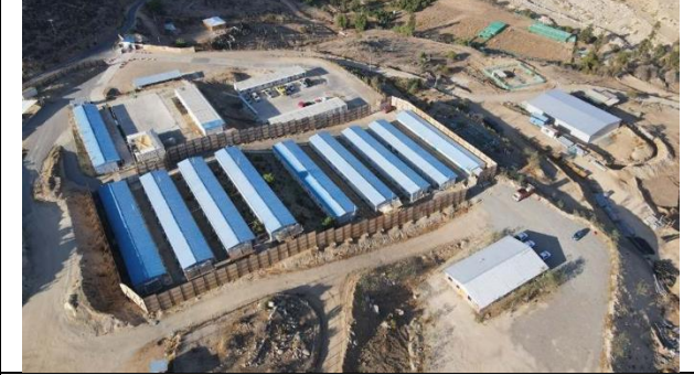
Fotografía N° 6 Instalaciones de Faena Soc. Concesionaria CHEC e Inspección Fiscal