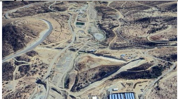
Fotografía N°3, Vista de las obras y campamento