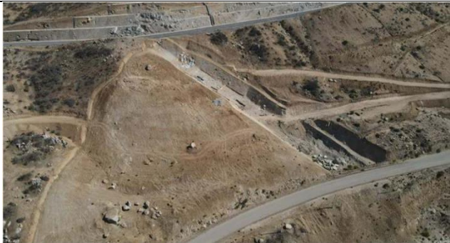
Fotografía N° 11. Plinto Derecho.