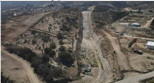
Fotografía N° 12. Evacuador de Crecidas y Rápido de Descarga.