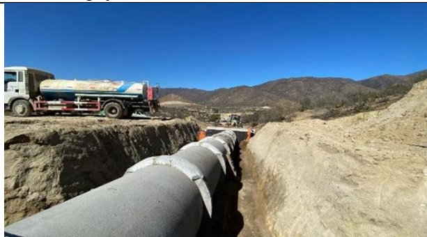
Fotografía N°2, Rellenos estructurales OA N° 21. Variante Ruta E315