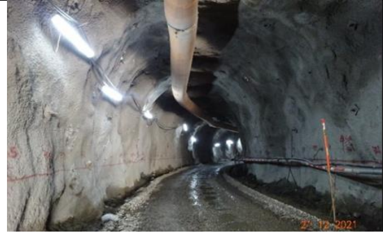
Vista General Túnel de Desvío - Portal Salida