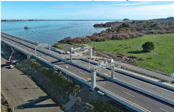
Sector A – Pórticos telepeaje – Hualpén