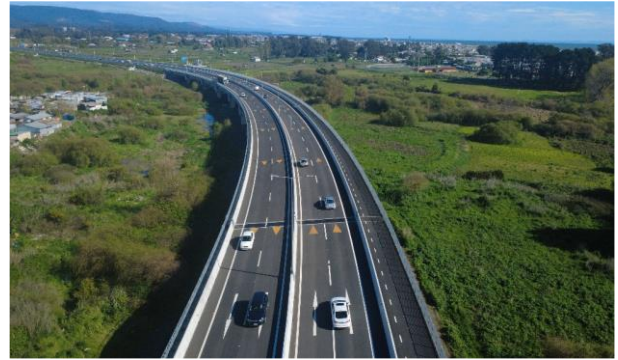
Sector C – Puente estribo sur - San Pedro de la Paz