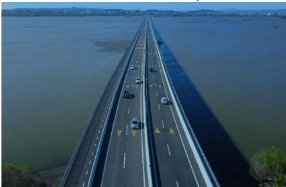
Sector B –Desde estribo Entrada norte – Hualpén