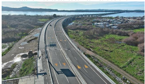
Sector C – Estribo Salida lado sur – San Pedro de la Paz