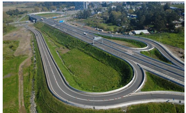
Sector C – Eje Troncal – San Pedro de la Paz