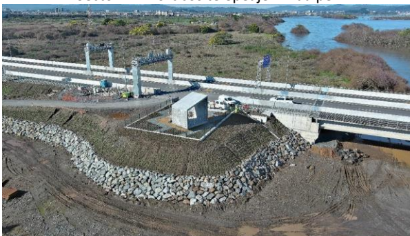
Sector A – Mirador – Hualpén