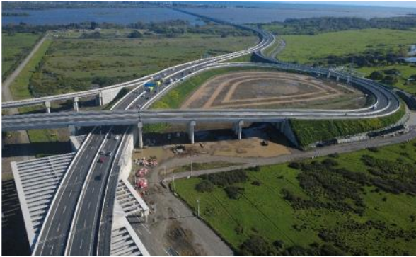
Sector A – Enlace Hualpén – Vista general