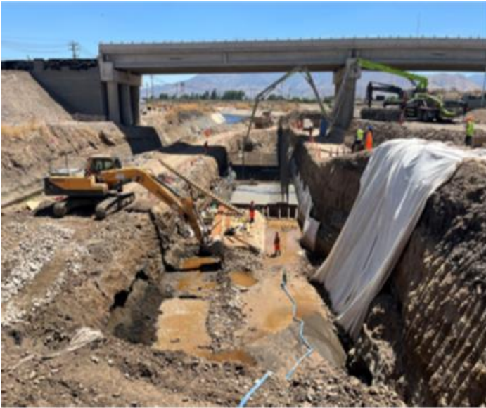
Canalización Estero Las Cruces Enlace Acceso Norte B3