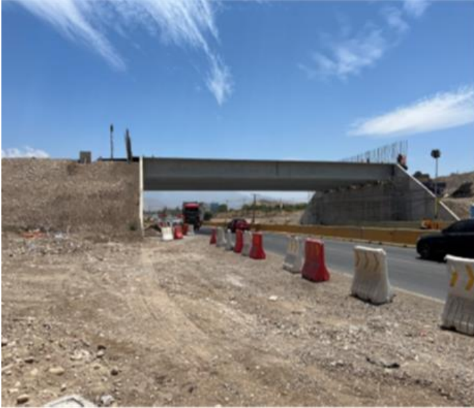
Montaje vigas PI Enlace Las Cruces Tramo B2