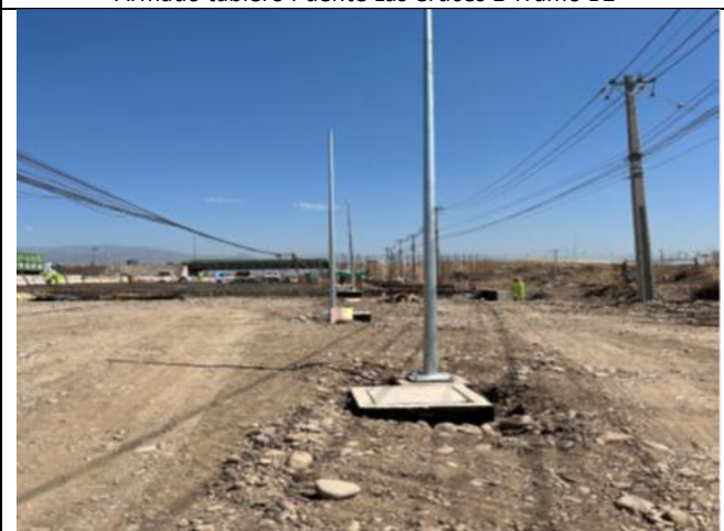
Montaje Postes Tramo B2