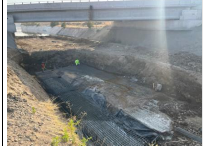
Canalización Estero Las Cruces Puente Las Cruces 2 tramo B4