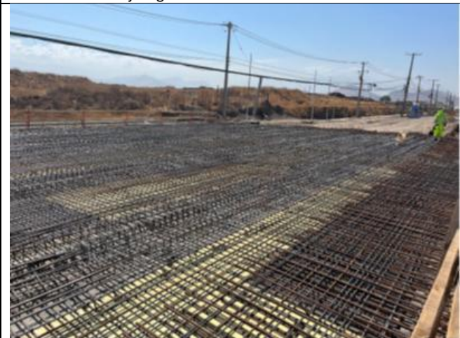
Armado tablero Puente Las Cruces 1 Tramo B2