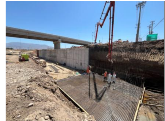
Canalización Estero Las Cruces Enlace Acceso Norte Tramo B3