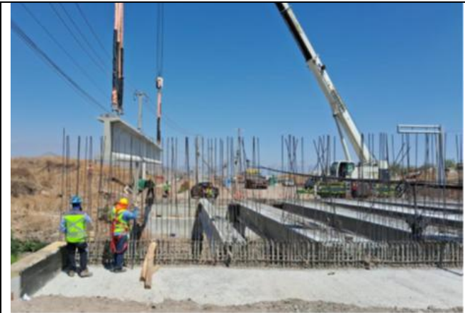
Montaje vigas Puente Las Cruces 1 ramo B2