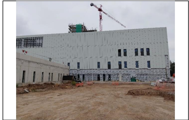
4.- Fachada Norte- Acceso principal