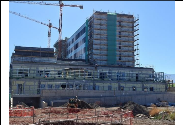
1.- Fachada Poniente