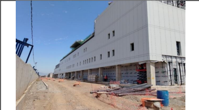
2.- Fachada Sur Oriente