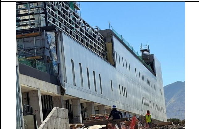
3.- Fachada Sur Poniente