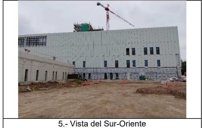
5.- Vista del Sur-Oriente