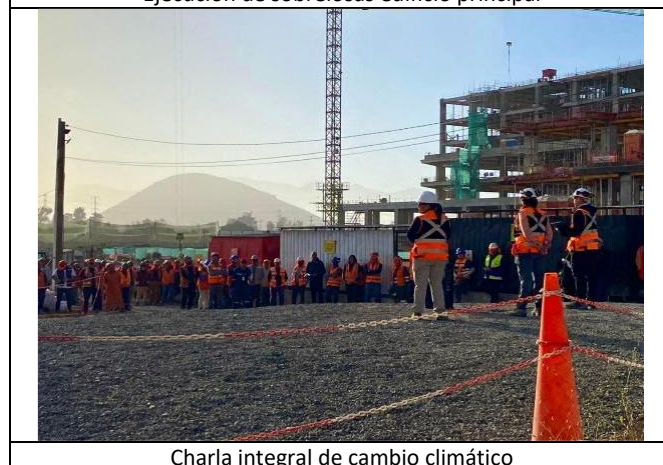
Charla integral de cambio climático