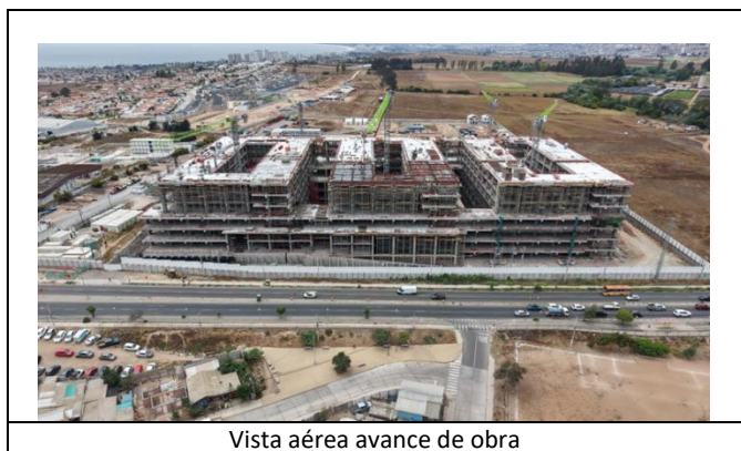
Vista aérea avance de obra