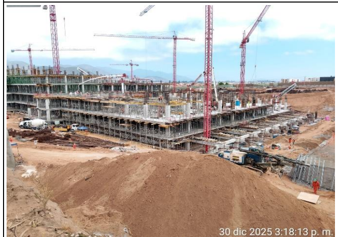
Vista Panorámica (Sector A)