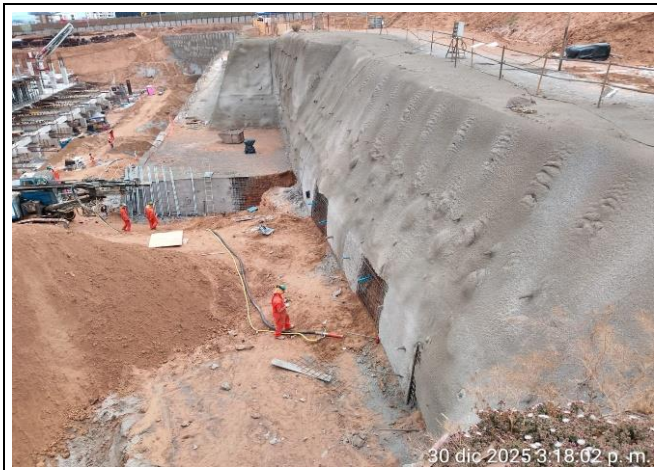
Sistema Soil Nailing - Refuerzo de Talud 7