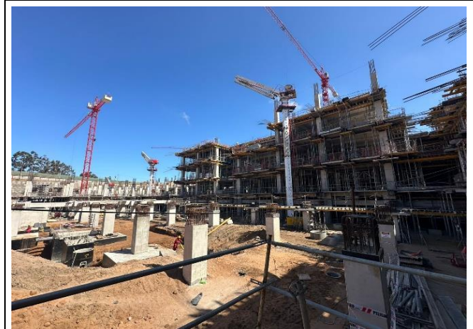
Vista Panorámica (Sector D)