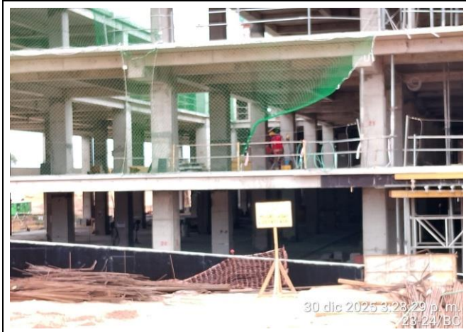
Vista General Niveles 1-2-3 (Sector E)