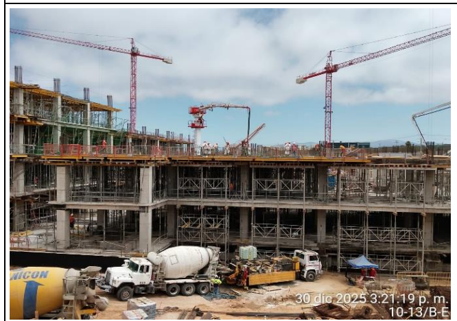
Vista Panorámica (Sector C)