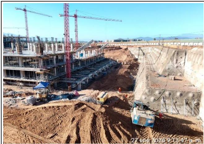
Vista Sectores A-B / Sistema Soil Nailing en Talud 7