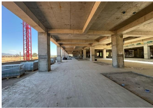
Instalación de Baldosas en nivel N2 (Sectores E-F)