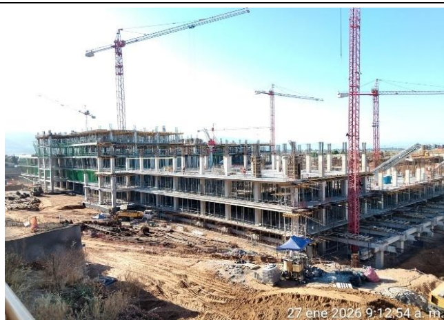
Vista Panorámica (Sectores A-B-C-D)