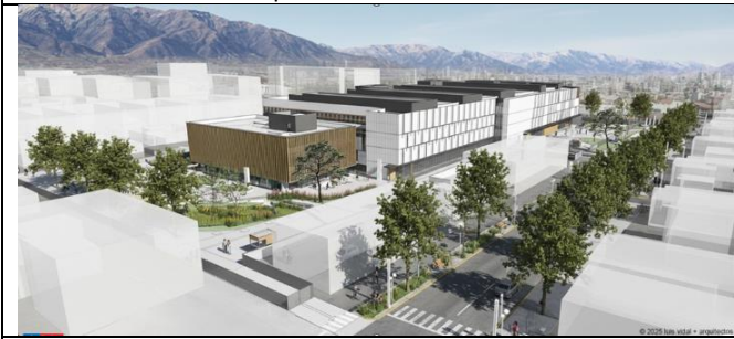
Vista norte -Plaza interior.