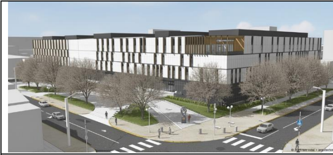
Vista poniente - Av. Salvador