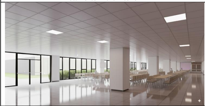
Vista interior – Casino.