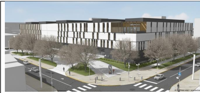
Vista poniente - Av. Salvador

El proyecto se encuentra en la fase de ingeniería.