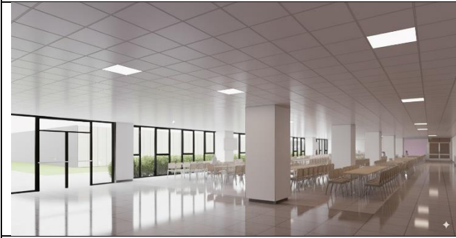
Vista interior – Casino.