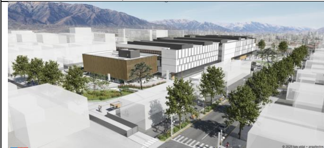
Vista norte -Plaza interior.