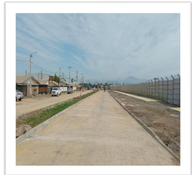
Av. Alonso de Ercilla (acceso principal)