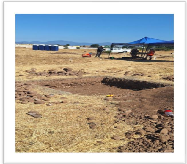
Labores de Arqueología