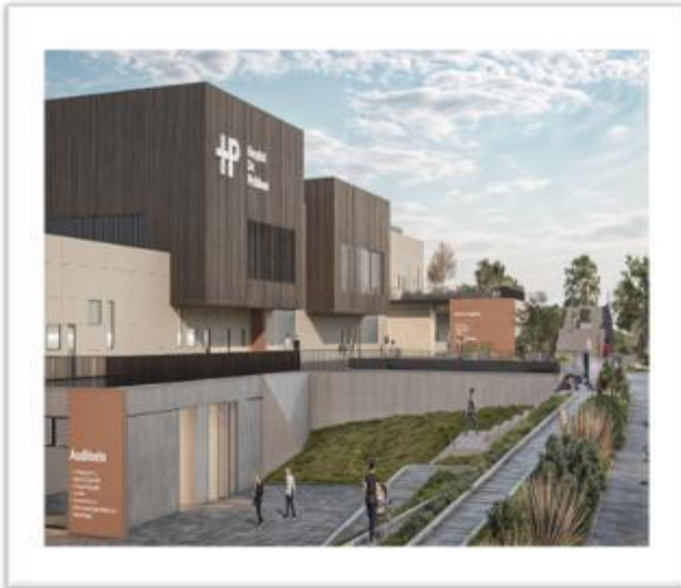
Imagen Virtual Fachada Hospital