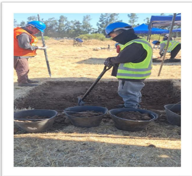
Labores de Arqueología