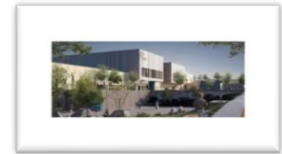
Hospital de Pichilemu