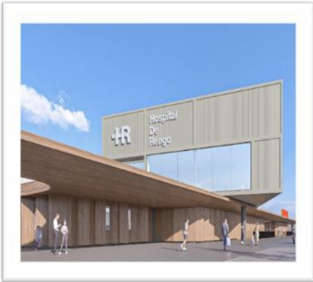
Imagen Virtual Fachada Hospital