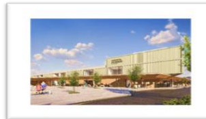
Hospital de Rengo

El proyecto, de acuerdo con lo establecido en el artículo 1.2.3 de las Bases de Licitación (en adelante BALI), comprende dos establecimientos de Salud: Hospital de Rengo ubicado en la avenida Alonso de Ercilla N°920, comuna de Rengo, Provincia de Cachapoal; y Hospital de Pichilemu ubicado en calle Camino Antiguo Punta de Lobos N°2.420, de la Comuna de Pichilemu, Provincia de Cardenal Caro. Los dos en la Región del Libertador General Bernardo O'Higgins. A continuación, se describen los aspectos generales que se contemplan en cada uno de los centros hospitalarios antes señalados.