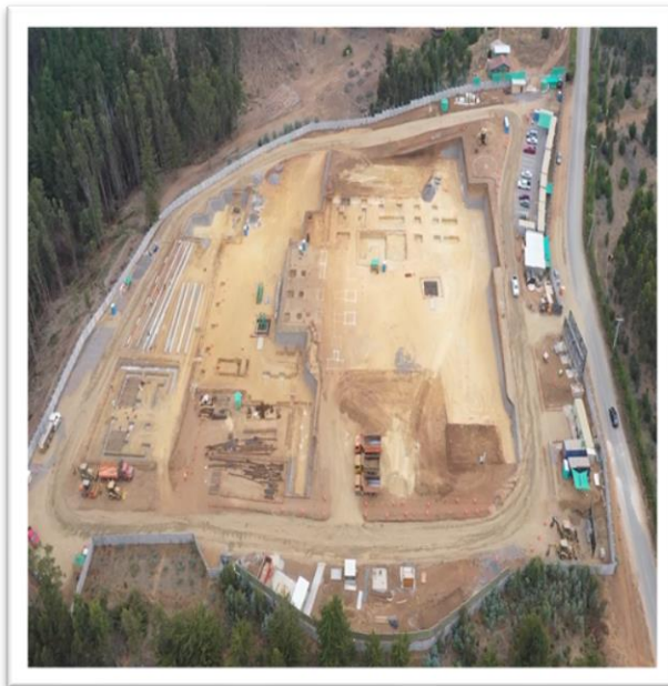
Terreno de Construcción – Vista 2