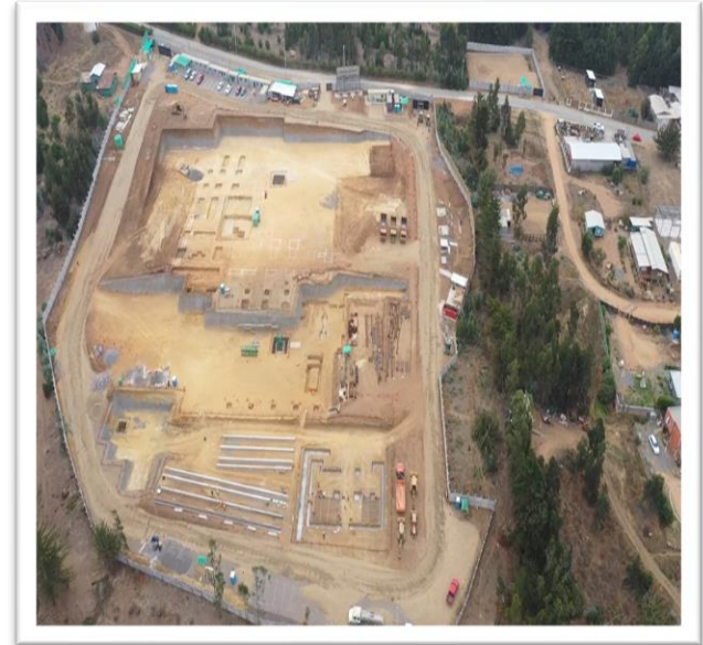
Terreno de Construcción – Vista 3