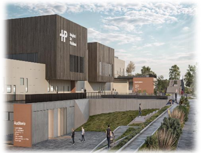
Figura – Fachada Acceso Hospital de Pichilemu