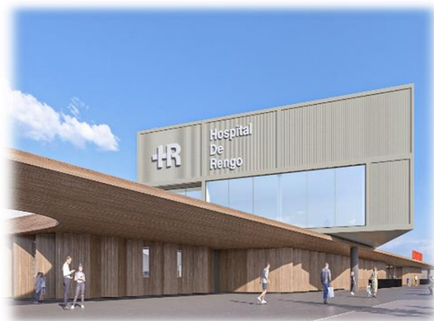
Figura – Fachada Urgencias Hospital de Rengo