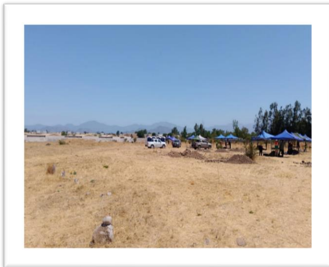
Figura – Terreno de construcción Hospital de Rengo