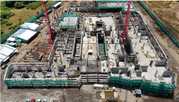
HOSPITAL DE SANTA BÁRBARA