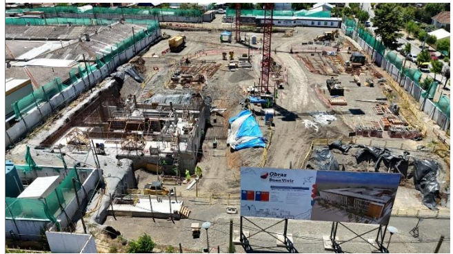
HOSPITAL DE NACIMIENTO