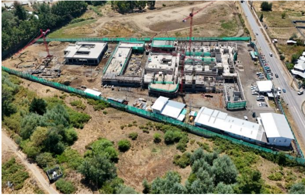
HOSPITAL DE SANTA BÁRBARA