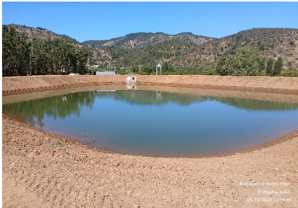
Imagen N°5. Vista general del tranque La Cabaña.

avance del contrato al mes de febrero 2026 de un 100,00%