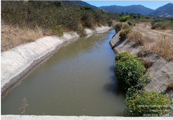
Imagen N°7. Canal Norte, km. 11+400. Pleno funcionamiento del sistema de regadío a la fecha.

Red de Riego: En febrero del 2026, se mantiene en óptimas condiciones el sistema de regadío tanto de canales, como de compuertas, tranques, bocatomas, etc. De manera permanente se realiza seguimiento, a la actividad de riego, sin mayores observaciones.