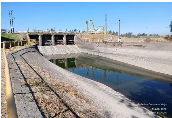
Imagen N°2. Vista aguas arriba canal Teno Chimbarongo y compuertas cerradas.

Mediante la Resolución (E) N° 1722, de fecha 07 de septiembre de 2020, se materializa la Puesta en Servicio Definitiva de las Fases I, II y III.