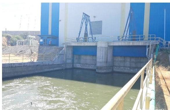
Imagen N°4. Vista general de la Central Hidroeléctrica.

El artículo 1.10.2.2 de las Bases de Licitación dispone que el Concesionario podrá ofrecer servicios de venta de energía eléctrica, tal que la producción sea compatible con los servicios señalados en las Bases de Licitación y cumpla con la legislación vigente relacionada con la materia. De acuerdo con esta norma, la Concesionaria desarrolló un proyecto eléctrico que consistió en la construcción de una Central Hidroeléctrica a pie de presa, de una potencia nominal de 16,4 MW, formada por dos turbinas Kaplán, cuyas obras se encuentran terminadas y en operación oficial desde febrero de 2019 según autorización del CEN, carta DE 01459-19) desde el 21 de febrero de 2019.