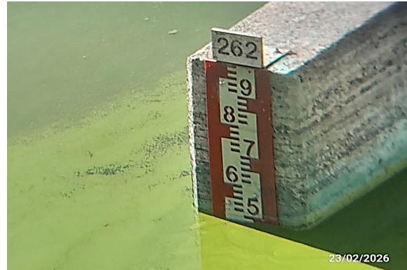
Imagen N°6. Cota 261,48 m.s.n.m. con un volumen de 92.351.416 m3 (09:36 horas) al 23.02.2026, presa auxiliar.