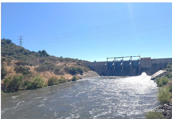
Imagen N°3. Vista aguas arriba y válvula Howell Bungler al 44% de apertura en la Presa Auxiliar.