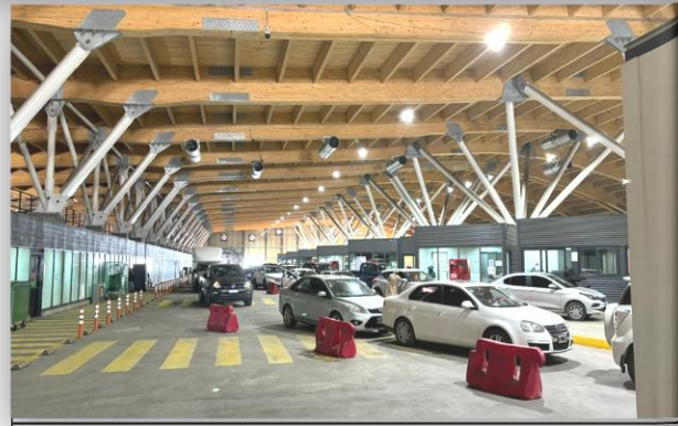
2. Zona de Vehículos Livianos