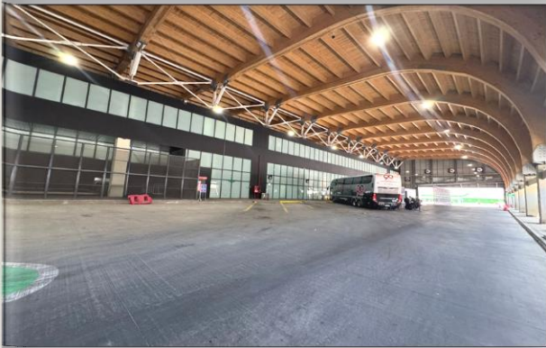
1. Zona de Buses