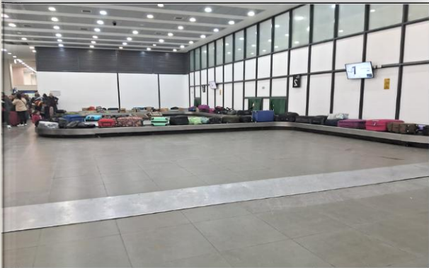
3. Zona de Aduana