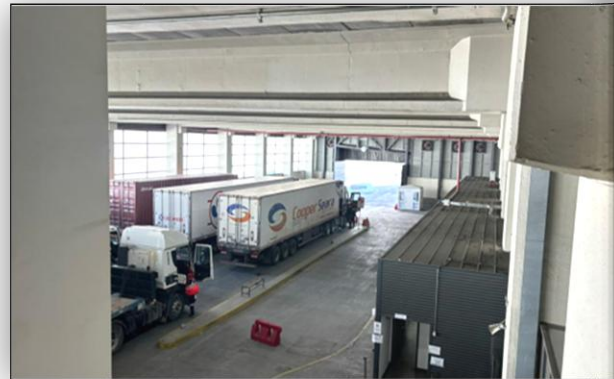
4. Zona de Camiones