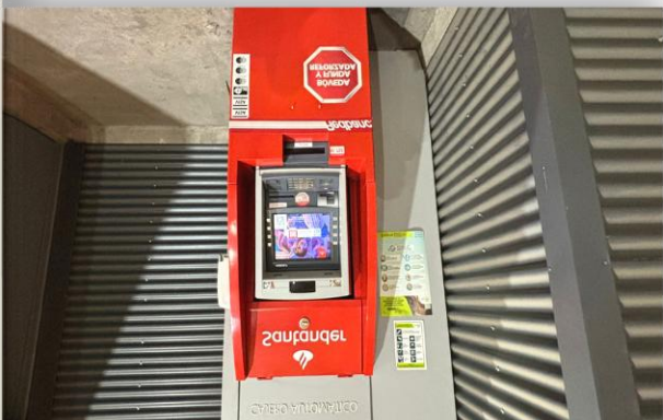
5. Zona Servicios