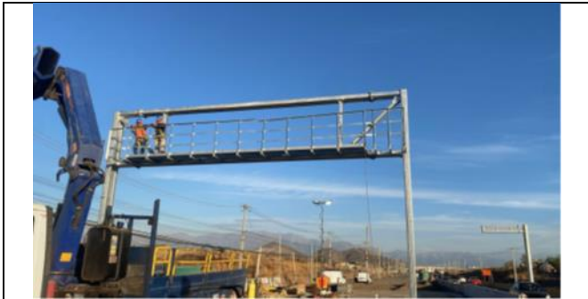
Montaje Panel Mensajería Variable tramo B2