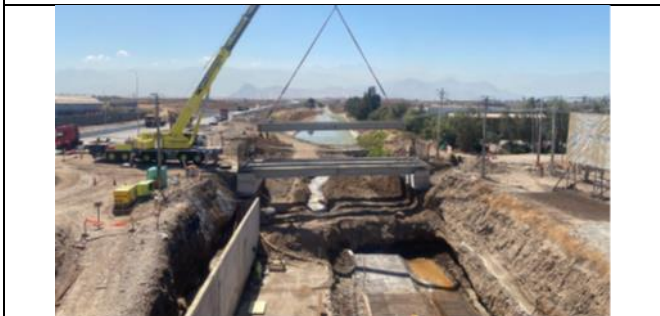
Montaje vigas Puente Lo Boza Tramo B4