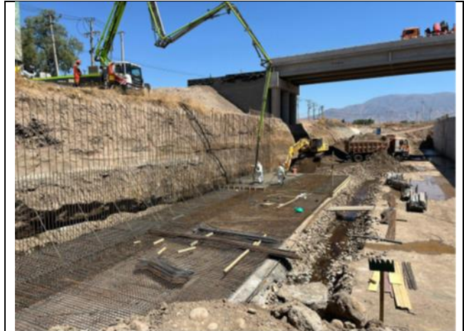
Canalización Estero Las Cruces Enlace Acceso Norte Tramo B4