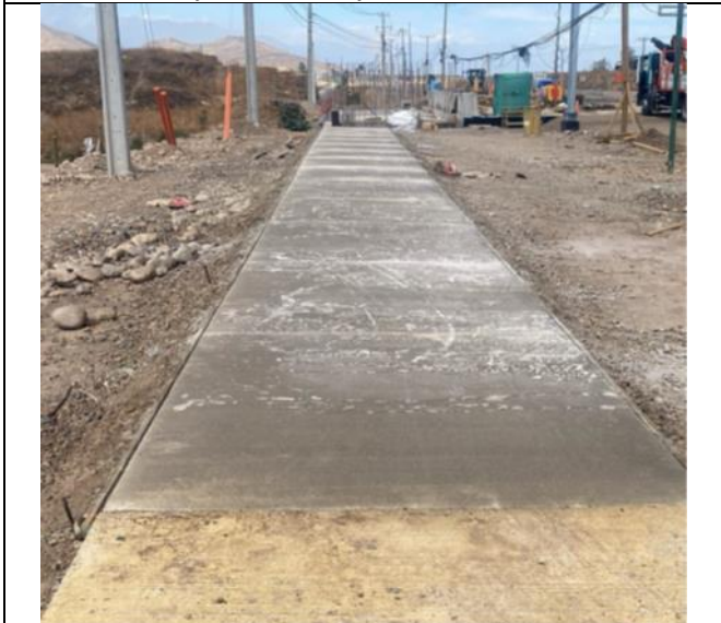
Aceras Tramo B2