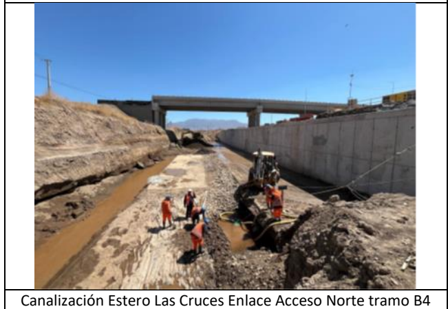
Canalización Estero Las Cruces Enlace Acceso Norte tramo B4