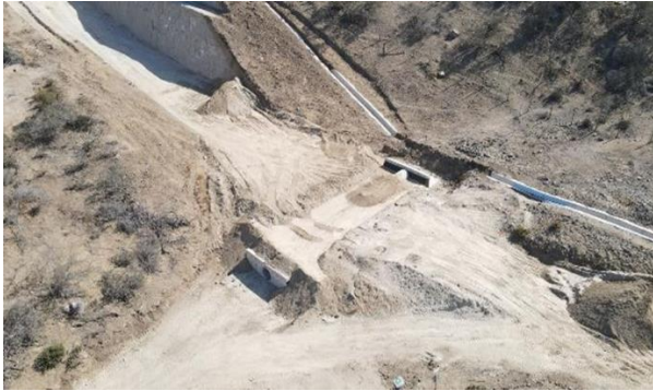
Fotografía N°1, Vista OA N°15. Variante Ruta E-315