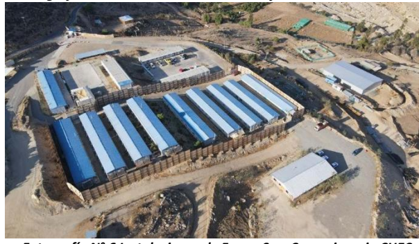
Fotografía N° 6 Instalaciones de Faena Soc. Concesionaria CHEC