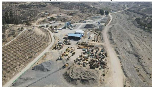
Fotografía N° 8. Lote 7, taller de maquinaria