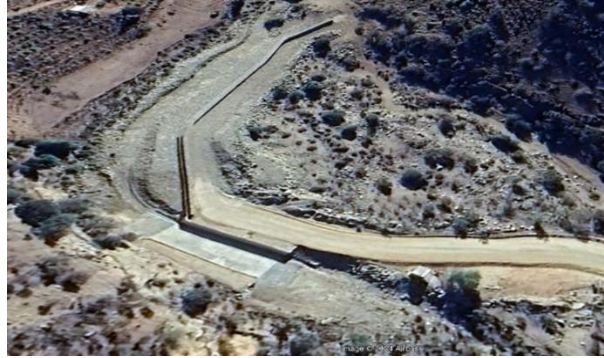
Fotografía N°5, Vista estación de control fluvimétrica Frutillar