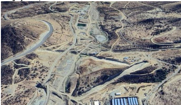
Fotografía N°3, Vista de las obras y campamento