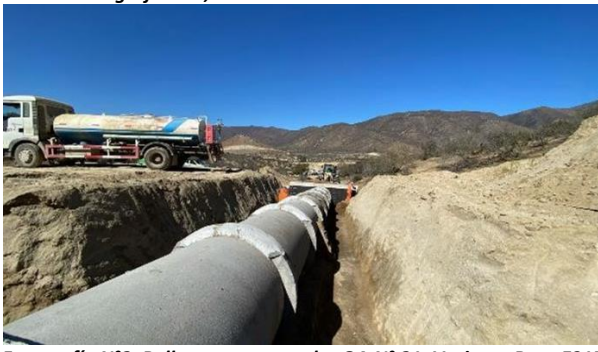
Fotografía N°2, Rellenos estructurales OA N° 21. Variante Ruta E315