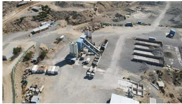
Fotografía N°7. Planta de hormigón