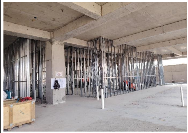
Instalación de Tabiquerías Nivel 1 (Sectores E-F)