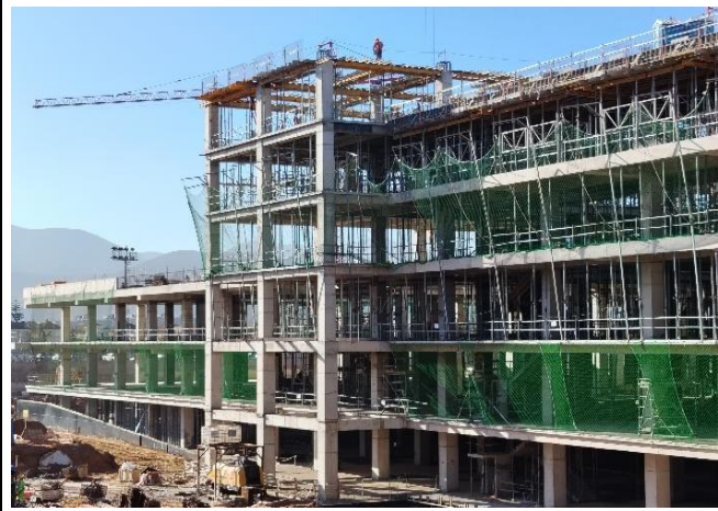
Vista fachada norte / Sectores C y E