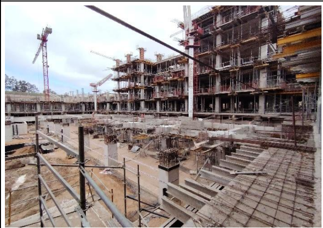
Vista Panorámica Sur (Sector D)