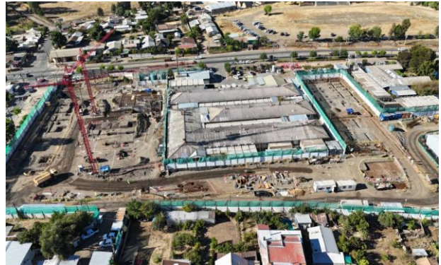
HOSPITAL DE NACIMIENTO