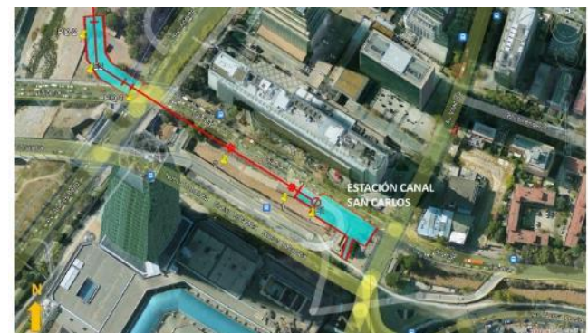
Ubicación Estación Canal San Carlos