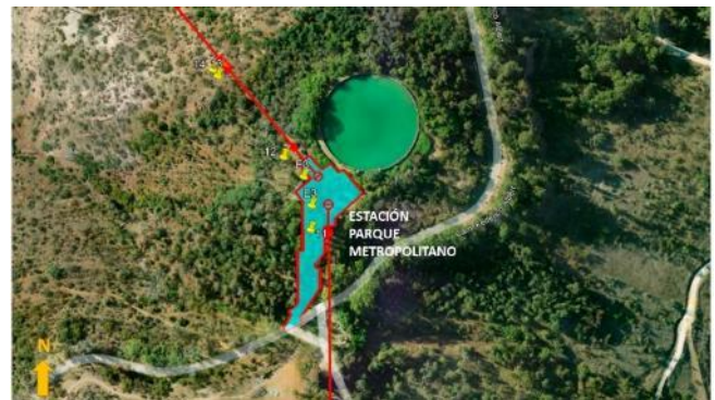
Ubicación Estación Parque Metropolitano