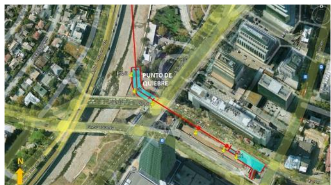
Ubicación Punto de Quiebre