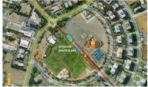
Ubicación Estación Santa Clara