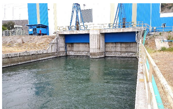
Imagen N°4. Vista general de la Central Hidroeléctrica.

El artículo 1.10.2.2 de las Bases de Licitación dispone que el Concesionario podrá ofrecer servicios de venta de energía eléctrica, tal que la producción sea compatible con los servicios señalados en las Bases de Licitación y cumpla con la legislación vigente relacionada con la materia. De acuerdo con esta norma, la Concesionaria desarrolló un proyecto eléctrico que consistió en la construcción de una Central Hidroeléctrica a pie de presa, de una potencia nominal de 16,4 MW, formada por dos turbinas Kaplán, cuyas obras se encuentran terminadas y en operación oficial desde febrero de 2019 según autorización del CEN, carta DE 01459-19) desde el 21 de febrero de 2019.