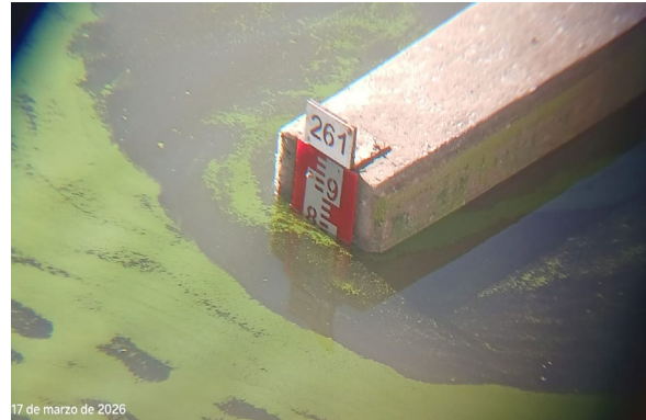
Imagen N°6. Cota 260,820 m.s.n.m. con un volumen de 82.528.919 m3 (10:20 horas) al 17.03.2026, presa auxiliar.