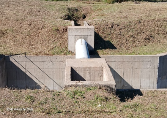
Imagen N°7. Canal Nilahue Tramo 2, km 1+280. Roce y despeje, control de vegetación área del atraveso del canal.

etc. De manera permanente se realiza seguimiento, a la actividad de riego, sin mayores observaciones.