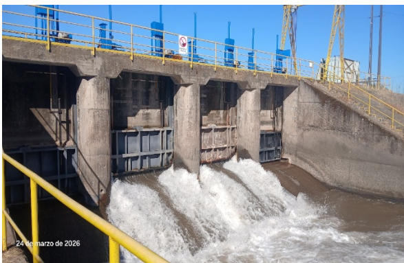
Imagen N°2. Vista aguas arriba canal Teno Chimbarongo y compuertas semiabiertas.

Mediante la Resolución (E) N° 1722, de fecha 07 de septiembre de 2020, se materializa la Puesta en Servicio Definitiva de las Fases I, II y III.