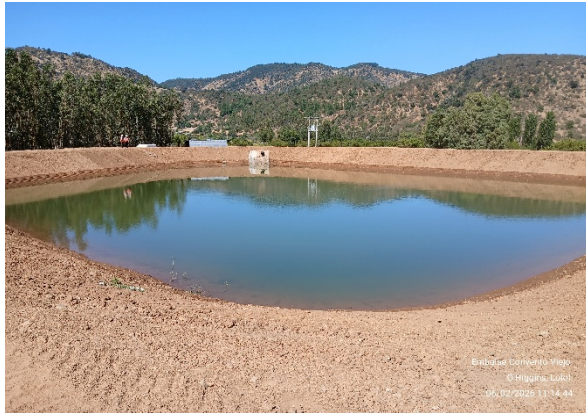
Imagen N°5. Vista general del tranque La Cabaña.