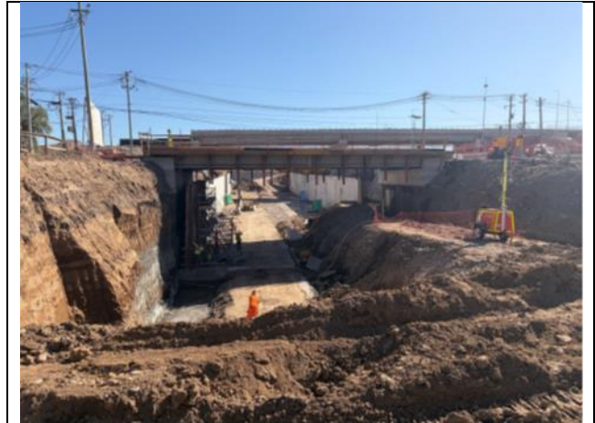
Canalización Estero Las Cruces Enlace Acceso Norte tramo B4