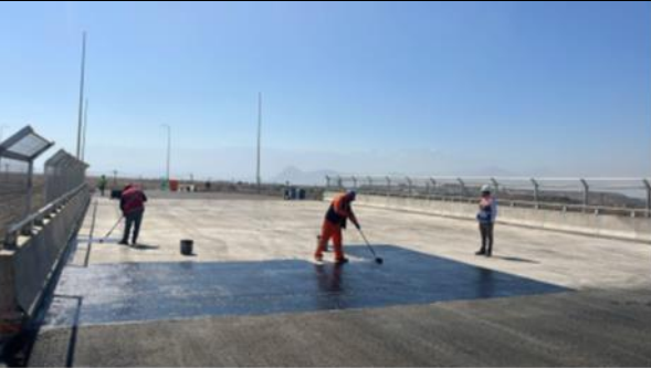
Impermeabilización Tablero PI Enlace Las Cruces Tramo B2