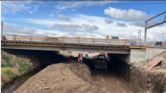
Canalización Estero Las Cruces Puesto Las Cruces 1 tramo B2