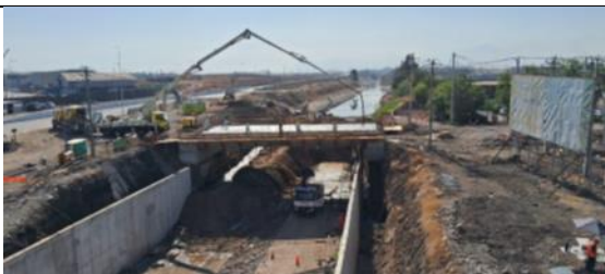
Tablero Puesto Lo Boza Tramo B4