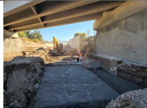
Canalización Estero Las Cruces Puesto Las Cruces 2 B3