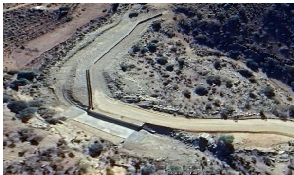
Fotografía N°5, Vista estación de control fluviométrica Frutillar