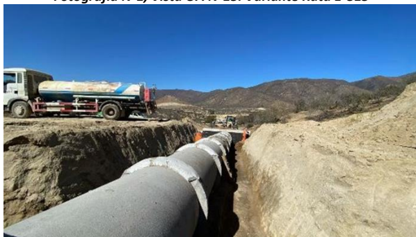
Fotografía N°2, Rellenos estructurales OA N° 21. Variante Ruta E315