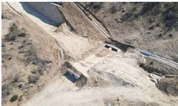
Fotografía N°1, Vista OA N°15. Variante Ruta E-315