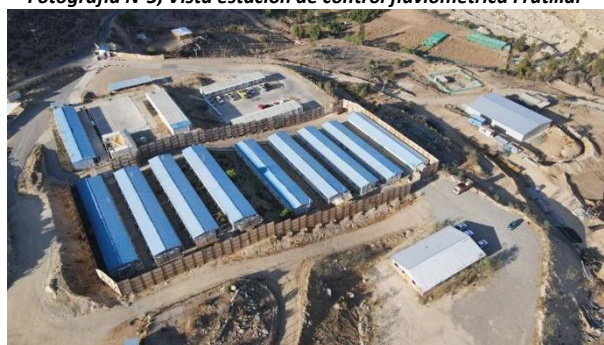
Fotografía N° 6 Instalaciones de Faena Soc. Concesionaria CHEC